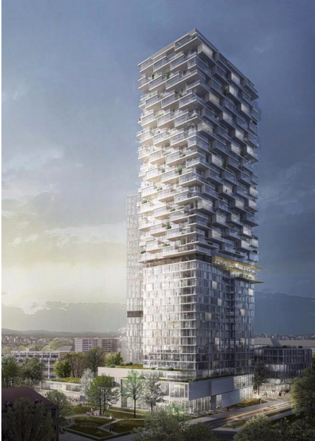
Abbildung: Campus Bockenheimer 2019: Hotel- und Wohnhochhaus “One Forty West” , links unten Mathe-Gebäude