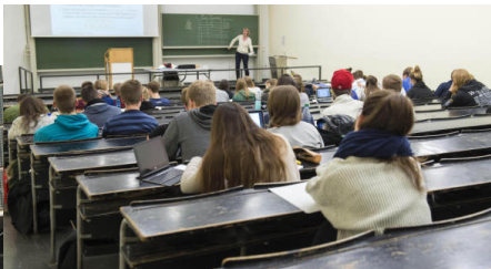
Abbildung: Campus Bockenheimer (Hauptfach Mathe, Nebenfach Info)