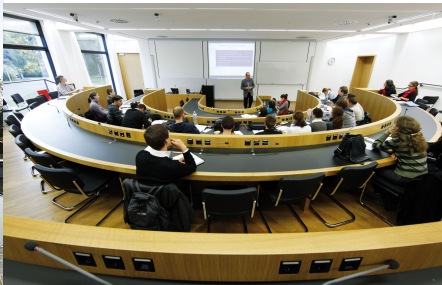
Abbildung: Campus Westend (Nebenfächer BWL, VWL, Finance, ...)